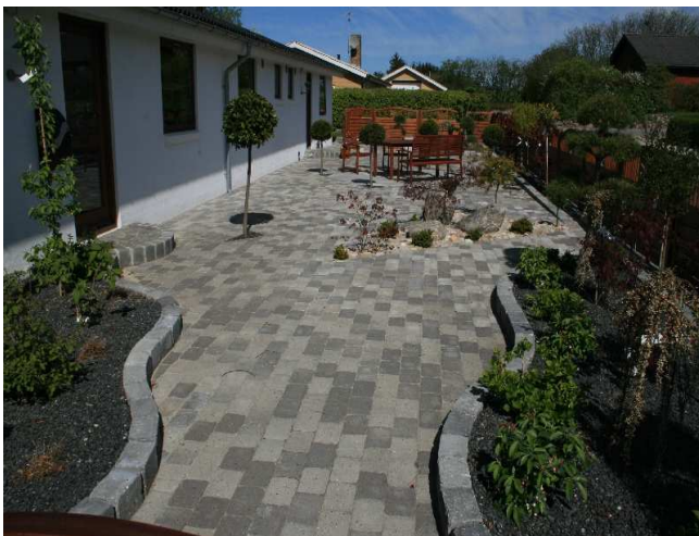
GråMix Herregårdssten med slået kant