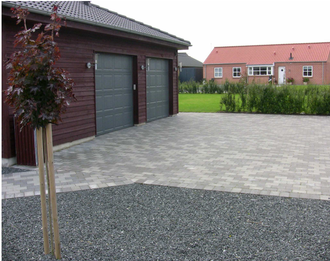
GråMix Herregårdssten med skarp kant