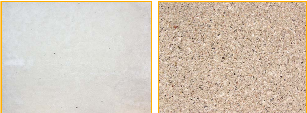
En glat (tv) og en afsyret overflade (th) har meget forskellige udtryk og ældes også forskelligt.

Afsyring af overfladen kan varieres fra let til meget kraftig, og som følge deraf naturligvis også både effektivitet og skade på overfladen. Uanset hvor lidt der afsyres vil det altid i et eller andet omfang skade overfladen, da princippet bygger på at fjerne et lag af overfladen, så afsyring skal kun anvendes hvis en hvis ændring af farve og tekstur kan accepteres, og bør udføres ens på alle flader der ses sammen, også selvom kun nogle dele behøver rensning. En afsyret overflade ældes nemlig også anderledes end en glat overflade, fordi porer og sandkorn i overfladen blotlægges.