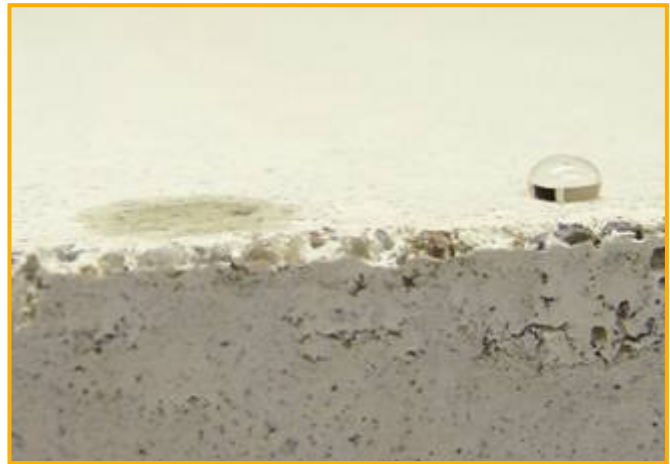
En behandlet og en ubehandlet overflade er først til at skelne når der placeres en vanddråbe på dem...

Ligesom for imprægneringsmidlerne er det vigtigt at konsultere leverandøren, så et egnet middel vælges og påføres korrekt - der er f.eks. stor forskel på hvor meget slid coatinger kan holde til.