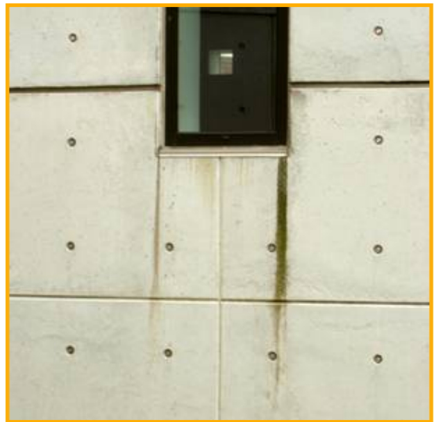
I dette tilfælde er årsagen til patineringen let at få øje på...

Fælles for dem alle er, at det nøje skal overvejes om det reelt er nødvendigt at gennemføre vedligeholdet - både reparationer og afrensninger kan skade en bygnings udtryk mere end de hjælper, hvis de ikke udføres korrekt, ligesom nogle forebyggende behandlinger kan ændre glans og farve af overfladen.