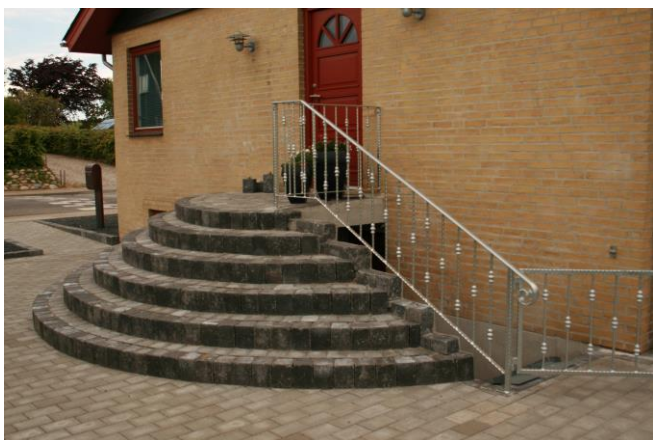
Rund trappe frilagt m. sort/antrasit granit