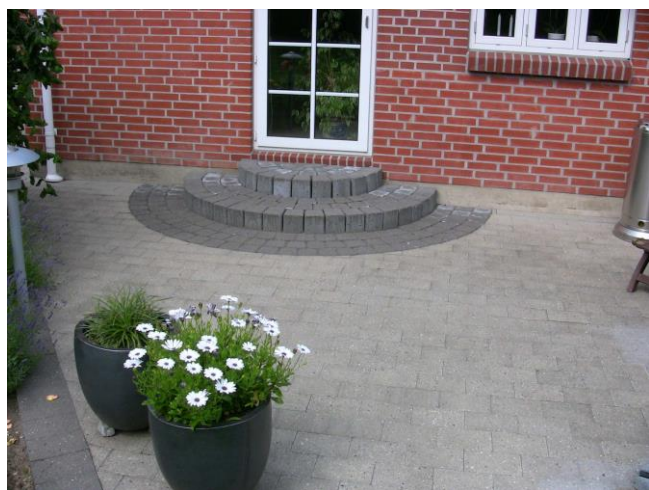
Specialfremstillet trappe m. frilagt granit