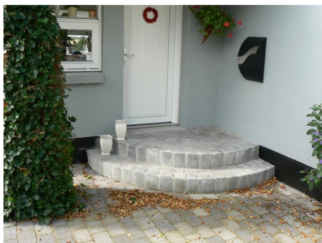
Specialfremstillet trappetrin til stålvanger