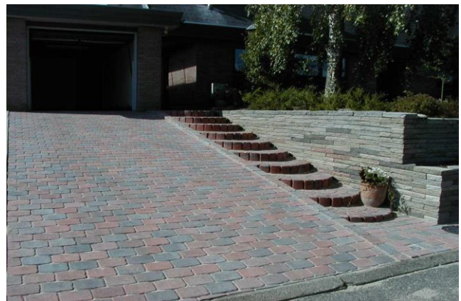
RødMix Herregårdssten med presset kant

Vægt. 4,1 kg. pr. sten eller ca. 138 kg. pr. m 2