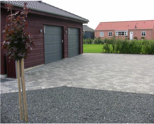
Gråmix m. skarp kant