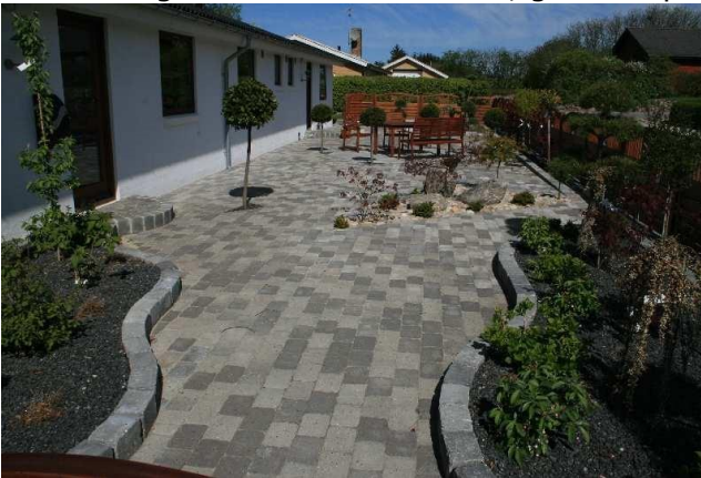
GråMix Herregårdssten med slået kant