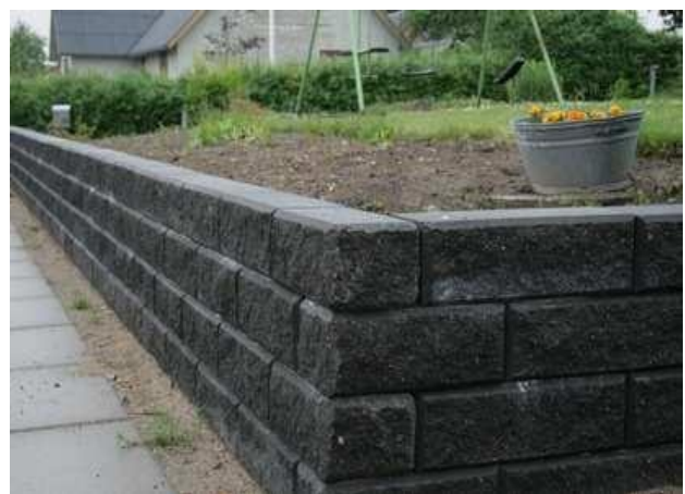
Romerblok, sort, knækket facade