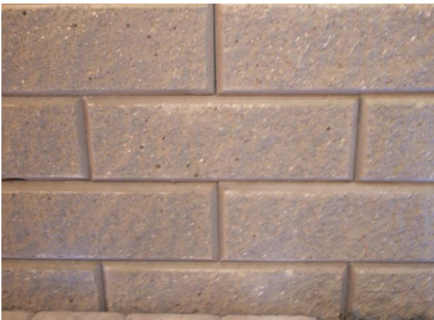
Romerblok, Grå, knækket facade

Vægt. 36 kg. pr. sten eller ca. 450 kg./m 2 .